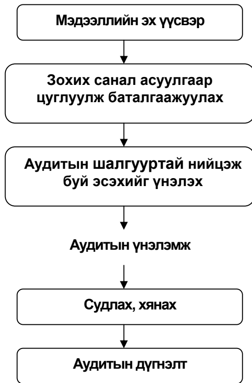
Зураг 3. Мэдээлэл цуглуулахаас аудитын дүгнэлтэд хүрэх хүртэл процесс